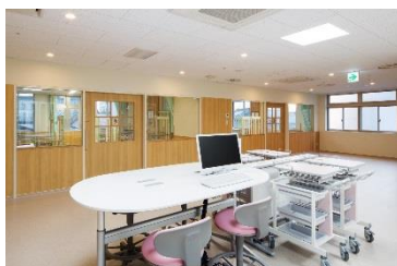
サービスステーション