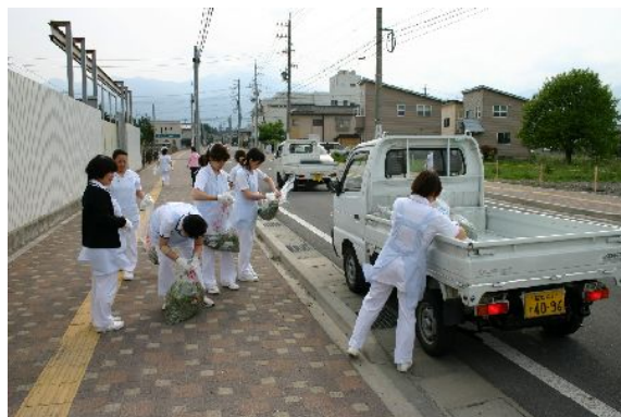
安曇野市一斉清掃へ参加の様子