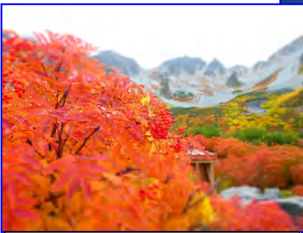
Q3:ここは何処でしょう?[難易度 ★☆☆☆☆]