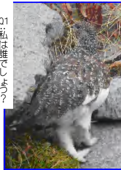
Q1:私は誰でしょう? [難易度 ★☆☆☆☆]