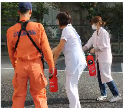
消火器訓練の様子

その後、新入職員を中心に、消火器の使用訓練を消防署員のご指導を受けながら行い、万一の事態への備えを固めました。