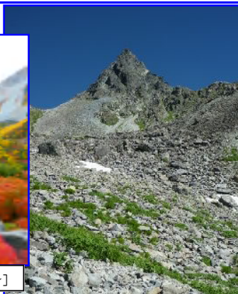
Q2:ここは何処でしょう?[難易度 ★☆☆☆☆]