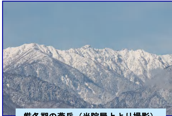
厳冬期の燕岳（当院屋上より撮影）

山を愛する人たちの心のほんの一部でも私にはわかったような気がする。私自身の感動も大きかった。これからもこうした感動を求めていきたい。 その後、3日間ばかり筋肉痛に悩まされたのだが。