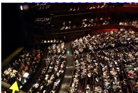
ここがオーケストラピットです

そば処浅田、ものぐさ、ラーメンかごしま屋あたりがお気に入りでしたが、浅田は最近休みがちだし、かごしま屋は閉店…さて、今年はどこに行こうかな？ たぶんラーメン屋かそば屋になるだろうけど…笑