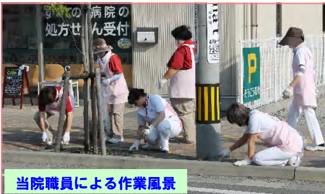
当院職員による作業風景

当院周辺の田沢街道で、草刈りやゴミ空き缶拾いを中心に清掃を行いました。集めたゴミの量は2袋と少な目でしたが、タバコの吸殻や空き箱などのゴミが目立ち、喫煙マナーの向上を願いたいところで