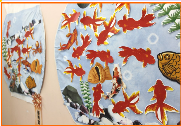
皆さんたくさん釣り上げました！

新型コロナウイルス第二波の流行のため、引き続き患者さんには外出を自粛していただいておりますが、その中でも季節のうつろいを感じていただくため、7月下旬〜8月初旬に、各病棟で夏祭りが開催されました。