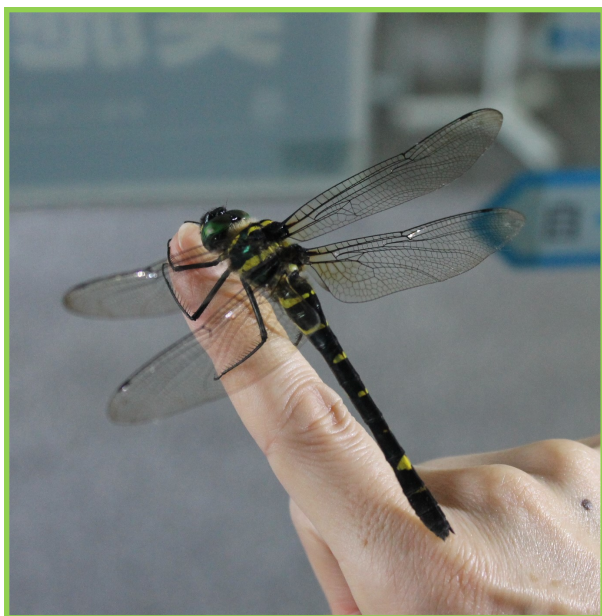
職員の指に乗るオオヤマトンボ(?)