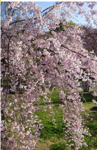
豊科近代美術館の桜

に注意しつつも外出がしやすくなります。今後も、患者さんに季節の変化を肌で感じて頂けるようハビリテーションを企画したいと思います。