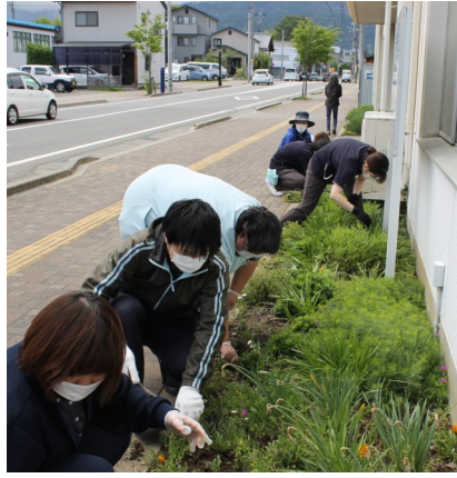
移植作業をする職員

色とりどりの花が咲いていますので、歩道を 歩かれる方に楽しんでいただきたいと思います。 す。