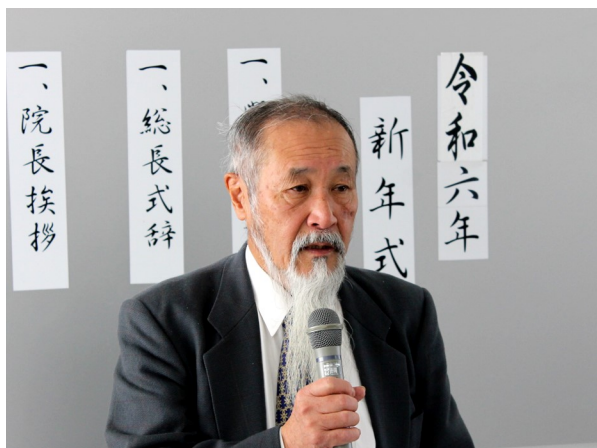
訓示する関 総長・理事長